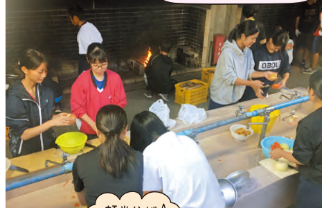
顔半分が熱いです...