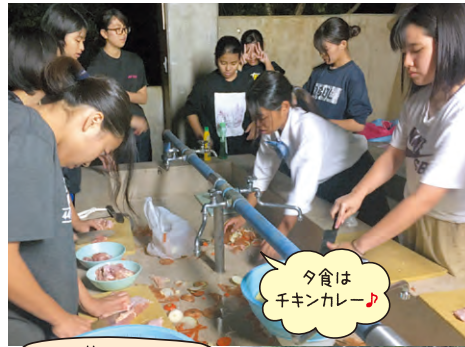
夕食は千辛カレー♪