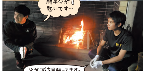
火加減を見張ってます。