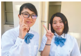
軽音楽部の2人も生徒会メンバー

名護高校生は、1人ひとりが個性豊かな生徒が集まり、誰もがリーダーとして学校を引っ張っていき意気込みを持っています。主な活動は、学園祭・体育祭や生徒総会、部活動推進大会や3年生を送る会などで、企画・運営・準備・片付けを全生徒に協力ももらって主導しています。10月から新生徒会長に変わり新しくスタートを切りました。様々な学校行事を生徒主体で創り上げ、盛り上げ、学校生活をより充実させることが目標です。