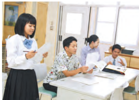
生徒さんが自発的にミーティングを進めます