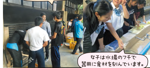
女子は水の湯の7千で器用に食材を刻んでいます。