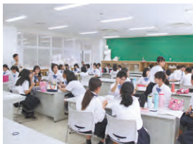
お昼休憩を利用したミーティング